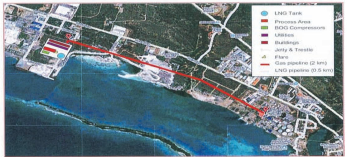
Figure: high level lay out of terminal infrastructure including connection line to the WEB facilities